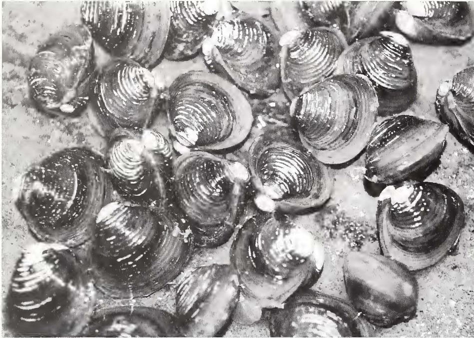
Fig. 1. Esemplari di Corbicula fluminea (Müller, 1774) raccolti immediatamente a nord della località Punta del Rio, frazione Pieve Vecchia, comune di Manerba del Garda, provincia di Brescia, nel febbraio 2002.

Fig. 1. Corbicula fluminea (Müller, 1774) specimens collected north to Punta del Rio site, (Pieve Vecchia, Manerba del Garda, Brescia) on February 2002.